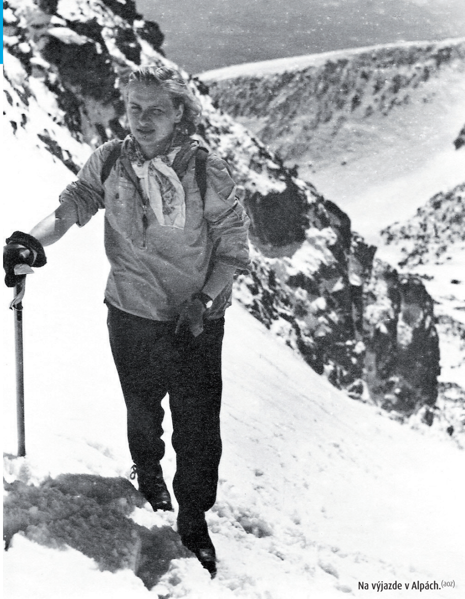
Na výjazde v Alpách. (a02)